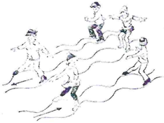
Рис. 1. Упражнения начинающих фигуристов на льду