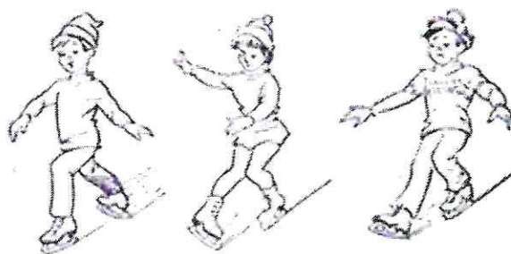
Рис. 3. Различные способы торможения